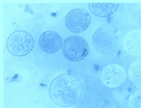
Elektronenmicroscopische opname van onze meervoudige liposomen.